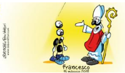
CRESIMA codice 0110231

MIELE TZETAL Mielero di Foresta CHIAPAS - MESSICO Prodotto da: Sociedad Cooperativa MIEL DEL SUR S. Cruzal - Chiapas - Mexico Confettionato da: Agricola De Angelis Via Rotta del Giardino, 24 S. Martino in Argine (BO) Importato e distribuito da: EQUOmercato commercio equo e solidale Via Cesare Cattaneo, 6 Carno / Luc. Vigliozzo (CO) Peso netto 180g e