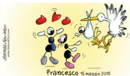
NASCITA codice 0110233

MIELE TZETAL Mielero di Foresta CHIAPAS - MESSICO Prodotto da: Sociedad Cooperativa MIEL DEL SUR S. Cruzal - Chiapas - Mexico Confettionato da: Agricola De Angelis Via Rotta del Giardino, 24 S. Martino in Argine (BO) Importato e distribuito da: EQUOmercato commercio equo e solidale Via Cesare Cattaneo, 6 Carno / Luc. Vigliozzo (CO) Peso netto 180g e