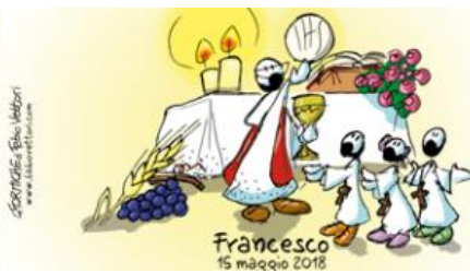
COMUNIONE codice 0110232

MIELE TZETAL Mielero di Foresta CHIAPAS - MESSICO Prodotto da: Sociedad Cooperativa MIEL DEL SUR S. Cruzal - Chiapas - Mexico Confettionato da: Agricola De Angelis Via Rotta del Giardino, 24 S. Martino in Argine (BO) Importato e distribuito da: EQUOmercato commercio equo e solidale Via Cesare Cattaneo, 6 Carno / Luc. Vigliozzo (CO) Peso netto 180g e